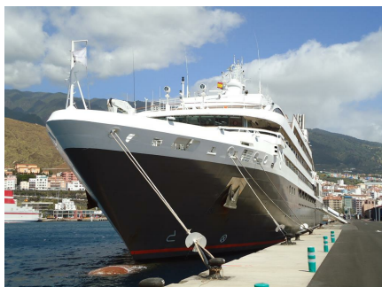
Tere Moana. Santa Cruz de La Palma. 8 de abril.