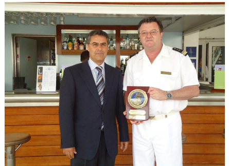
Celebrity Reflection. Santa Cruz de Tenerife. 29 de abril.