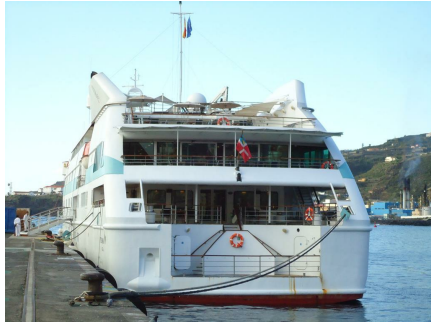
ClubMed2. Santa Cruz de La Palma. 20 de abril.