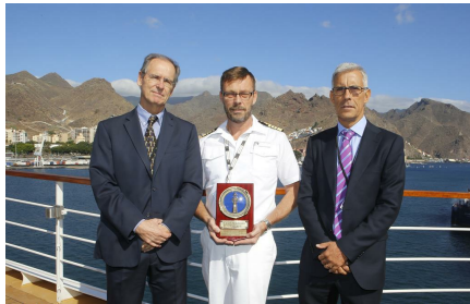
Seabourn Quest. Santa Cruz de Tenerife. 1 de noviembre.