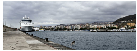
Independence of the Seas. Santa Cruz de La Palma. 12 de mayo.