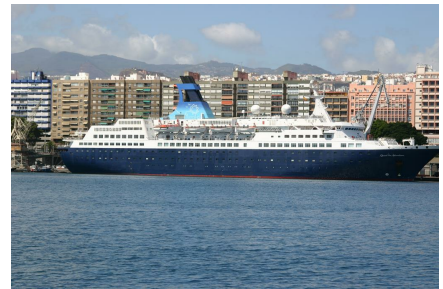
L'Austral. Santa Cruz de Tenerife y Santa Cruz de La Palma. 3 y 5 de abril.