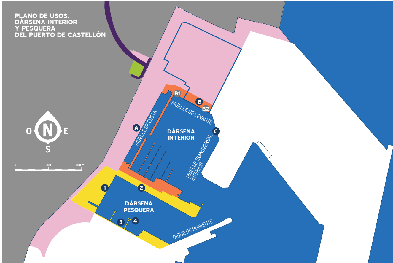
PLANO DE USOS. DÁRSENA INTERIOR Y PESQUERA DEL PUERTO DE CASTELLÓN