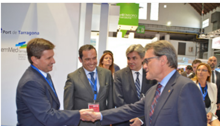
Visita del presidente Artur Mas en el stand del Port en Salón Internacional de Logística. Visit of the Catalanian President, Artur Mas, to the Port of Tarragona stand at the International Logistics Exhibition (SIL).