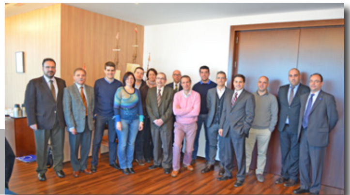
Reunión de Transprime en el Port de Tarragona. Transprime Meeting at Port of Tarragona.