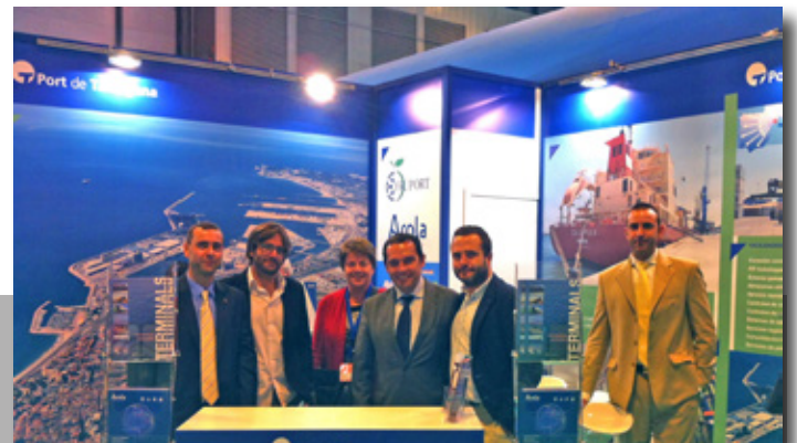
El Port de Tarragona en la feria Fruit Attraction en Madrid. The Port of Tarragona trade stand at the Fruit Attraction Exhibition.