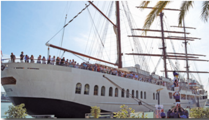
Llegada del crucero Sea Cloud . Arrival of the Sea Cloud cruise.