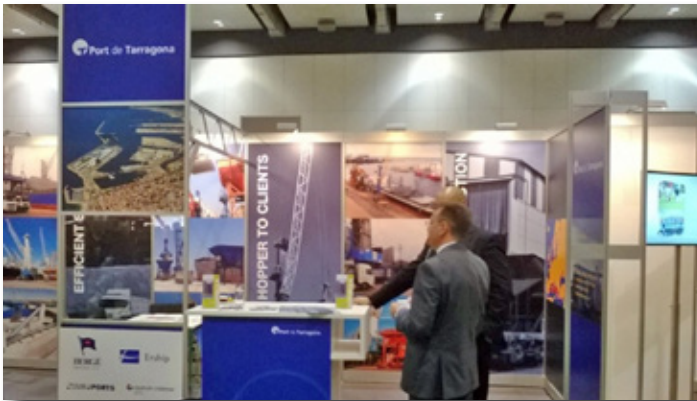
Participación en la 54th European Commodities Exchange (Hamburgo). 54th European Commodities Exchange (Hamburg).