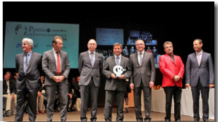
El Port recibe el galardón en los Premios a la Internacionalización de la Cámara de Comercio de Reus. Port of Tarragona receiving an award from the Reus Chamber of Commerce.