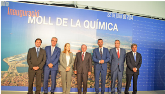
Representantes políticos durante la inauguración muelle de la Química. Formal photograph of the political representatives at the opening Chemical quay.