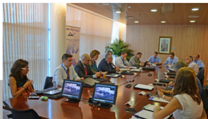
Workshop International Port Systems Association, celebrado al Port de Tarragona. International Port Systems Association workshop held at Port of Tarragona.