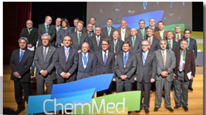
Constituci3n del clúster ChemMed con los representantes institucionales. Institutional representative at the launch of the chemical cluster ChemMed.