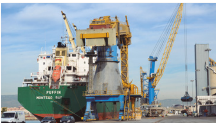
Transporte de estructuras metálicas en el barco Montego. Loading of project cargo on to the Montego.