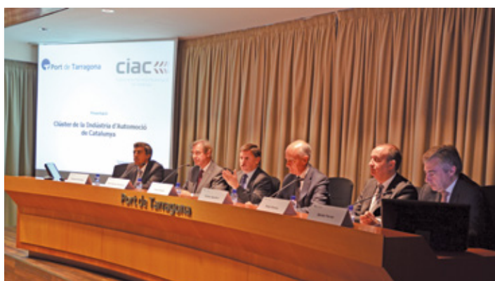
Reuni3n del Clúster de la Industria de Automoci3n de Catalunya. The Catalan Automotive Industry Cluster (CIAC) meeting.