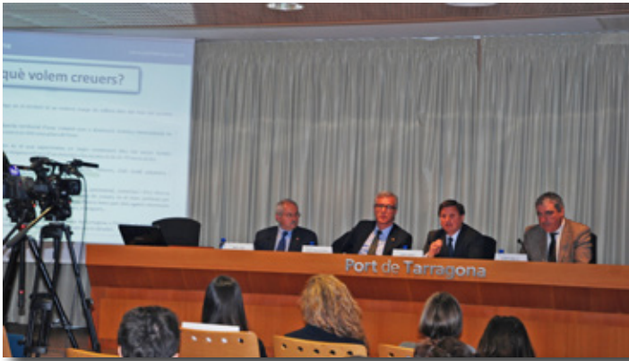
Reunió de Tarragona Cruise Port con la Mesa de Cruceros. Meeting of Tarragona Cruise Port with cruise stakeholders.