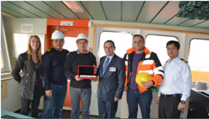
Recepción del barco Torm Valborg , primer petrolero de 100.000 t en el muelle de la Química. Reception of the Torm Valborg, the first 100.000 t oil tanker in the Chemical Quay.