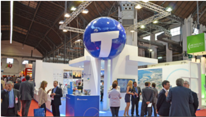
Stand en el SIL del Port de Tarragona con colaboración de ChemMed. Port of Tarragona stand in collaboration with ChemMed at SIL.