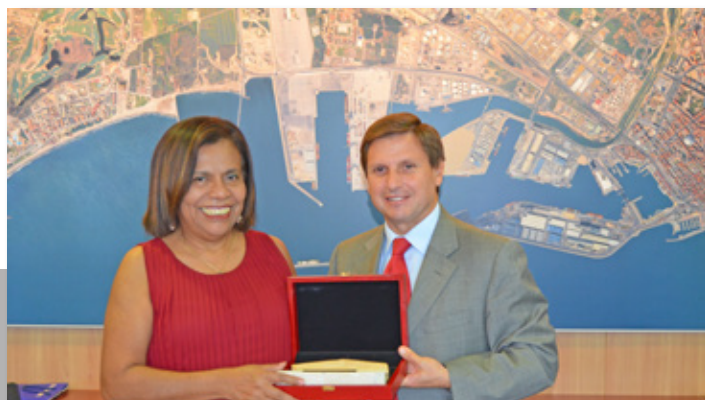
Visita de la embajadora de Nicaragua al Port de Tarragona. The Nicaraguan Ambassador visiting Port of Tarragona.