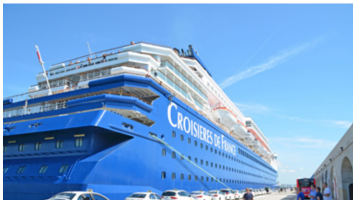
Llegada del crucero Horizon en el dique de Llevant. Arrival of the Horizon cruise ship at Llevant dock.