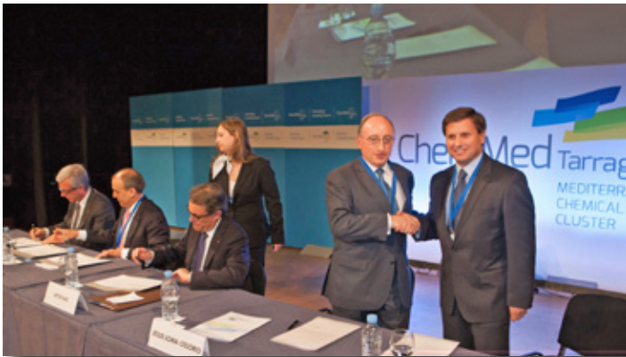
Los presidentes del Port de Tarragona y de la AEQT en la constituci3n de ChemMed. The Presidents of the Port of Tarragona and AEQT at the launch of ChemMed.