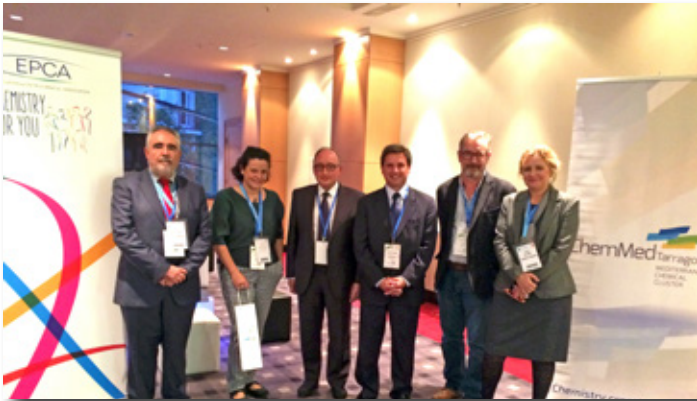
ChemMed se presenta a la EPCA. Presentation of ChemMed Tarragona at the EPCA.