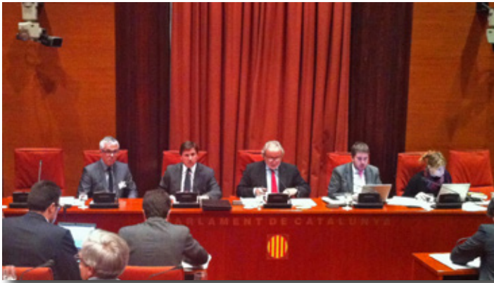
Mesa de Cruceros en el Parlament de Catalunya. The cruise stakeholders at the Catalanian Parliament.