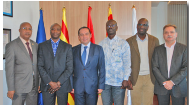
Visita de los empresarios de Guinea Bissau al Port de Tarragona. Guinea Bissau businessmen visiting Port of Tarragona.