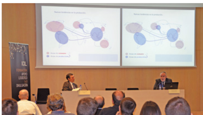
Presentación Jornada ICIL en Expoquímia. Presentation of ICIL Day at Expoquímia