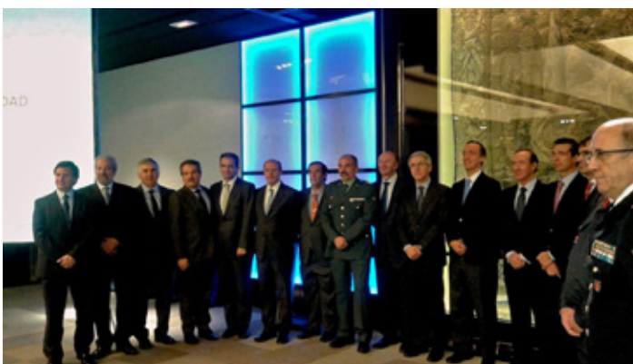
El Port de Tarragona recibe en Madrid el Premio al sistema de seguridad organizado por la revista Seguritecnia. Port of Tarragona receiving the award for its security system organized from the magazine Seguritecnia in Madrid.