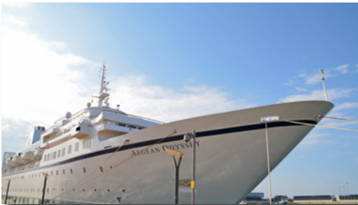
Llegada del crucero Aegean Odyssey en Marina Tarraco. Aegean Odyssey cruise ship arriving at Marina Tarraco.