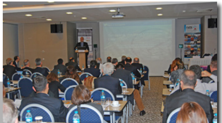
Presentaci3n de la estrategia intermodal a Rail Expansion Summit en Estambul. Presentation of the intermodal strategy at the Rail Expansion Summit in Istanbul.