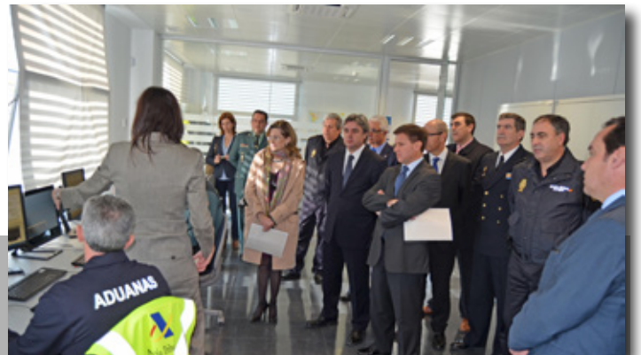
Inauguración del escáner de contenedores con las autoridades locales. The launch of the container scanner with people from local authorities.