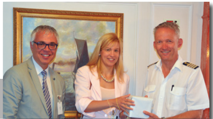
Recepción del crucero Sea Cloud . Reception of the Sea Cloud cruise.