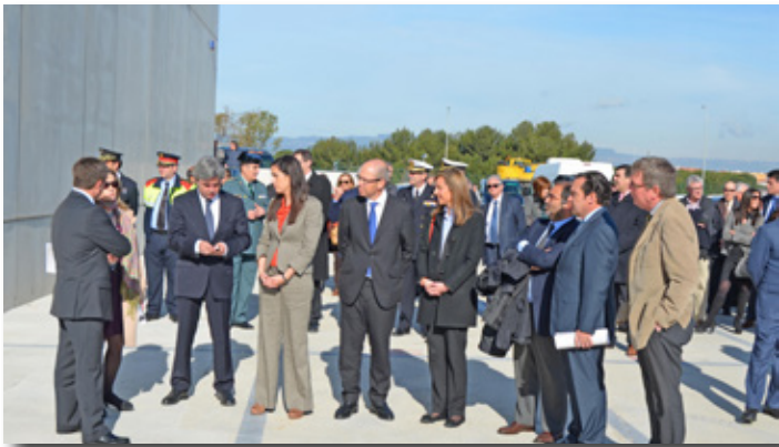
Inauguración del escáner de contenedores en muelle de Andalucía. The launch of the container scanner at Andalucía dock.