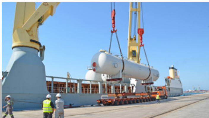
Carga de grandes piezas en el muelle de Castella. Loading of project cargo at Castella dock.