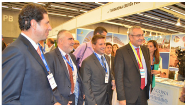
Promoción de cruceros en la feria de Seatrade Med. Cruise promotion at the Seatrade Med trade show.