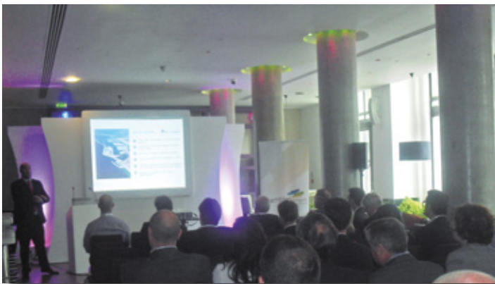
El Port de Tarragona presenta sus servicios logísticos en Tankbank T12 London. Port of Tarragona presenting its logistics services at London Tankbank T12.