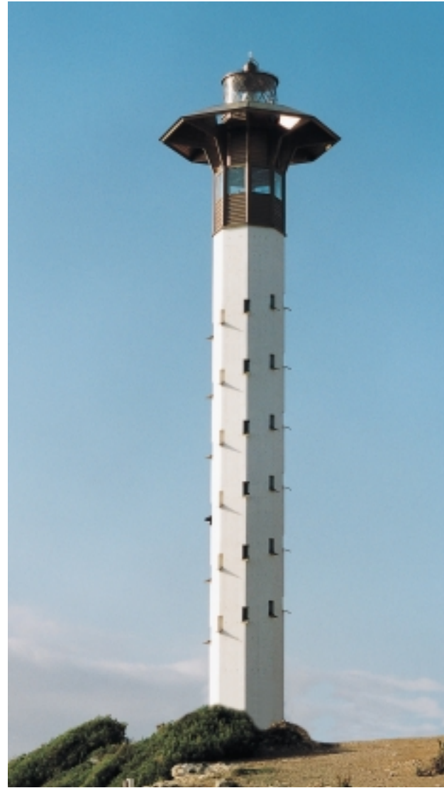
Faro de Torredembarra. Último faro construido.