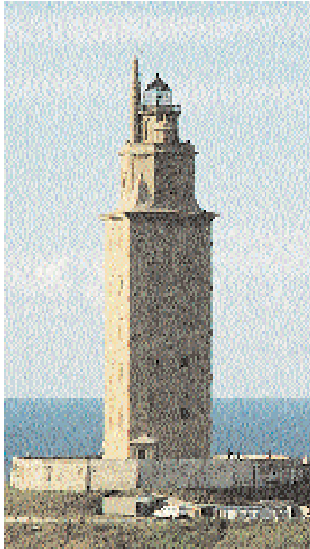
Torre de Hércules. Faro más antiguo del mundo en servicio.