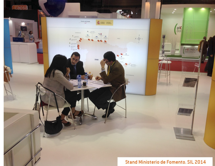
Stand Ministerio de Fomento. SIL 2014

Para ello, es necesario que la iniciativa privada se involucre de manera activa en esta estrategia, de manera que, entre todos, posicionemos a nuestros puertos en primera línea del mercado marítimo mundial.