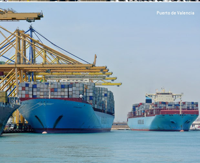
Puerto de Valencia