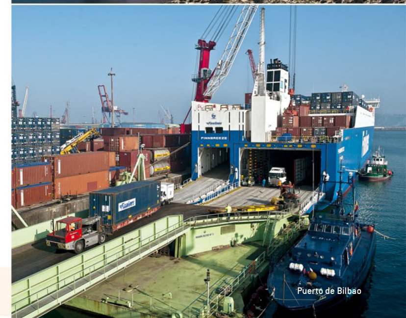
Puerto de Bilbao