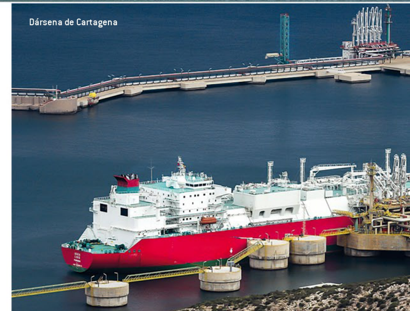
Dársena de Cartagena