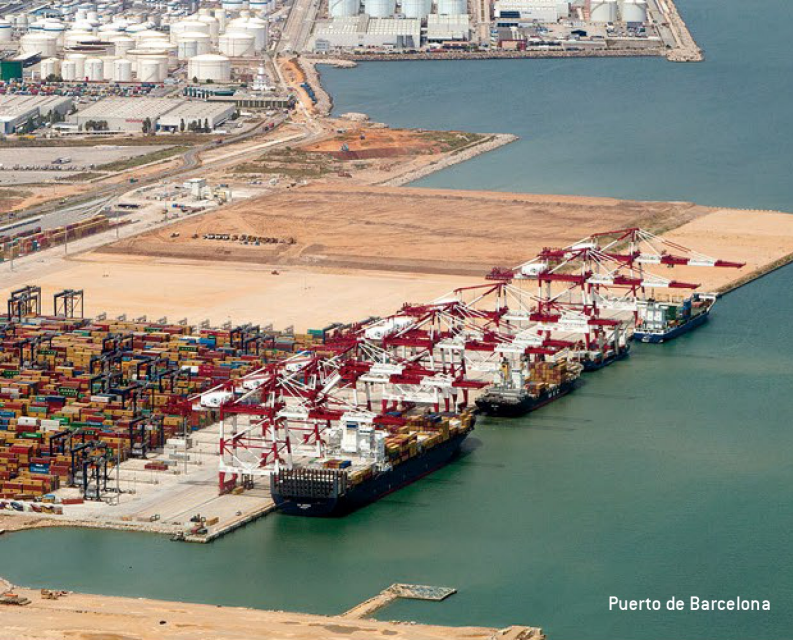
Puerto de Barcelona