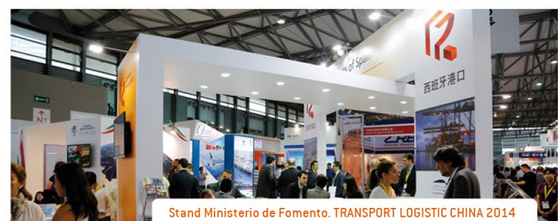
Stand Ministerio de Fomento. TRANSPORT LOGISTIC CHINA 2014