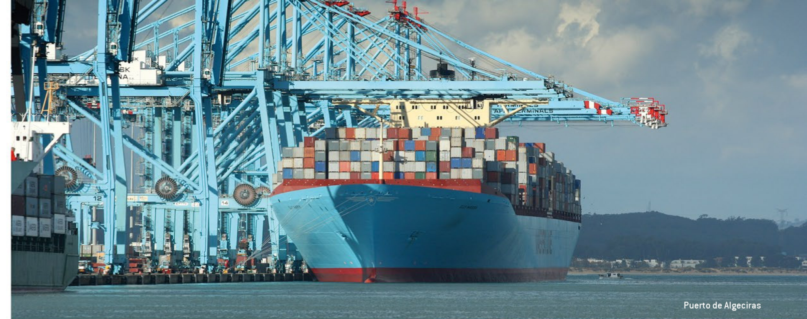
Puerto de Algeciras