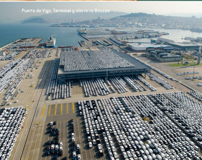
Puerto de Vigo. Terminal y silo ro-ro Bouzas